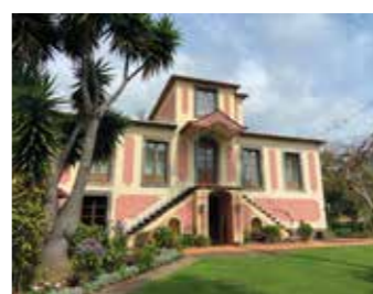
Fachada principal da Casa Mãe

O hotel Quinta Splendida, outrora denominada Quinta da Estrela que era residência de verão, é um imóvel datado dos finais do séc. XIX, construída em pedra aparelhada e rebocada, composta por dois pisos e uma característica pequena torre avista-navios, com o intuito de ver o mar. Insere-se na gramática maneirista do estilo Fachada principal da Casa Mãe chão, característica dos solares portugueses. Com fachadas austeras, possui vãos com simples molduras em cantaria regional e escada exterior de dois lanços, de acesso ao andar nobre, na mesma pedra. Na chaminé podemos ainda hoje observar o desenho da estrela que deu nome à quinta.