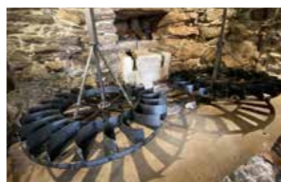
Pormenor do mecanismo do moinho

De destacar o imponente cubo que assenta sobre uma larga e extensa muralha em pedra aparelhada, à vista, que vai encabeçar na levada junto à casa do Relógio de Água. No interior do moinho ficou visível esta elaborada construção constituída por grandes pedras basálticas.