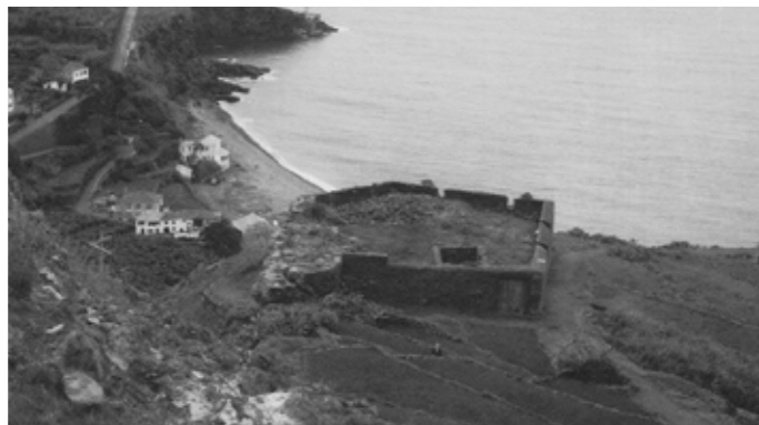
Perspectiva do Forte, sítio do Porto Novo, fotografia de 1970

O Forte do Porto Novo foi mandado construir, em 1828, pelo Tenente Paulo Dias de Almeida para defesa da costa, apresenta planta poligonal irregular, com isolada casa da guarda rectangular de duas divisões e restos do paiol a norte. Podemos observar vestígios do antigo lajeado da esplanada.