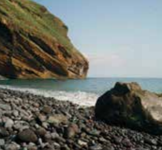
Ponta do Garajau

O topónimo Garajau (andorinhas do mar) tem este nome devido a João Gonçalves Zarco que, aquando da descoberta da ilha e se dirigia para a futura zona do Funchal, ali naquela ponta da falésia, encontrou muitas dessas aves marinhas (e que ainda hoje se podem observar a fazerem voos rasantes à água, na tentativa de encontrar alimento).