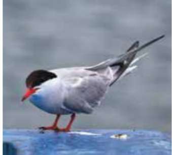
Garajau (Sterna hirundo)

Nesta zona foi criada a primeira Reserva Marinha de Portugal, em 1986. Conhecida pela elevada limpidez das suas águas (permitindo observações a mais de 20 metros de profundidade), a Reserva possui elevada biodiversidade com uma riqueza ictiológica muito significativa. Pela sua localização geográfica e principalmente pela sua riqueza biológica e águas transparentes e limpas, apresenta grande aptidão de utilização do ponto de vista recreativo, educativo e científico. É uma área onde se dinamiza a prática do mergulho amador e funciona como forte atrativo para a deslocação de inúmeros mergulhadores amadores à Região.