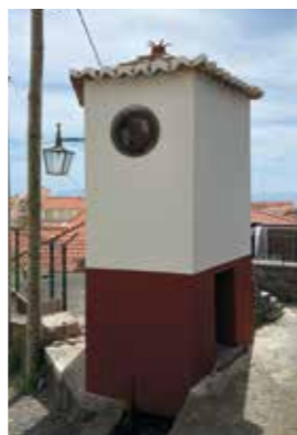
Relógio de Água

Trata-se de uma construção paralelepípedica em pedra basáltica aparelha e rebocada. Possui uma pequena porta de acesso com molduras em cantaria e óculos redondos na mesma cantaria para o mostrador do relógio, já desaparecido.