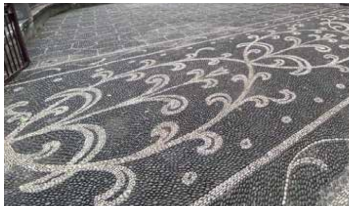
Pormenor do adro da Igreja

A inusitada alta torre sineira é já do séc. XIX, que sofreu uma ampliação com a introdução de um coruchêu em betão, no século seguinte, para albergar os sinos.