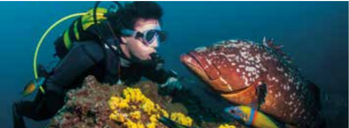
Mero (Epinephelus marginatus) na Reserva do Garajau

Os fundos marinhos são povoados por uma abundante e residente fauna. O afável e simpático Mero ( Epinephelus marginatus ) é a espécie emblemática da reserva, atraindo e despertando a curiosidade dos mergulhadores.