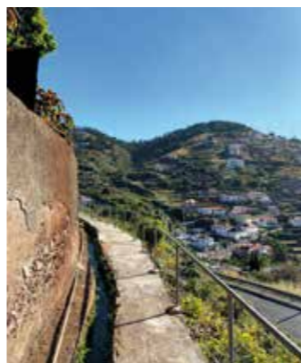
Panorâmica do percurso