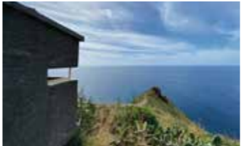
Posto de vigia baleeira

Em frente da escultura do Cristo Rei na Ponta do Garajau, podemos ainda encontrar uma Vigia de Baleias, outrora muito importante para a caça desde mamífero, sendo mesmo a praia do Garajau um importante ancoradouro para desmanche das baleias e sua transformação.