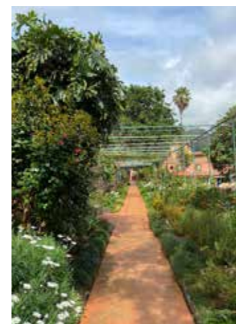
Jardins: corredor tradicional

Aqui, depois de percorrer este extenso roteiro patrimonial, poderá tomar um chá ou uma bebida refrescante, usufruindo do agradável ambiente bucólico e sereno. Deixe-se ficar.