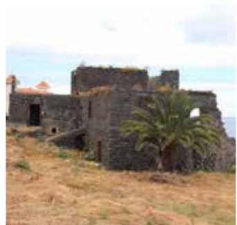
Perspectiva poente do conjunto

O Solar dos Reis Magos é uma ruína de um imóvel do séc. XVIII, construído em aparelho de pedra basáltica, de vários volumes escalonados e telhados múltiplos, apresentando uma característica torre avista-navios do lado nascente à face da fachada principal. Esta torre apresenta uma interessante e bem executada porta-janela articulada, em cantaria regional, com ombreiras relevadas, volutas e largos entablamentos com cornijas pronunciadas e ornatos. No tardoz do imóvel ainda é possível observar os vários fornos da cozinha em cantaria vermelha do Caniçal.