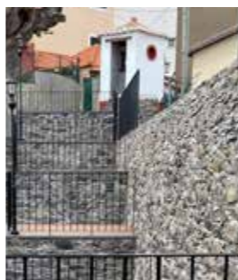
Muralla do cubo

O pequeno imóvel é coberto por um telhado de quatro águas em telha de meia cana.