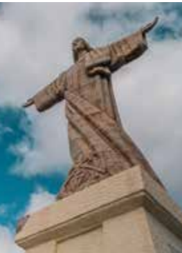
Monumento ao Cristo Rei

O Cristo Rei do Caniço foi mandado levantar pelo Conselheiro Aires de Ornelas (1866-1930), nascido na Quinta das Almas, na Camacha, era filho do último Morgado do Caniço e foi ministro da Marinha e Colónias.