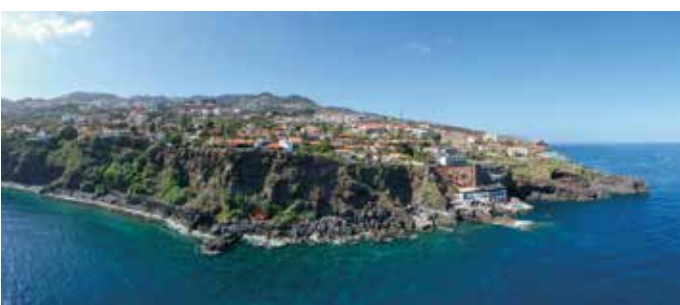
Ponta da Oliveira, Caniço de Baixo

A Paróquia do Caniço foi fundada em 1438 ou 1440, sendo uma das mais antigas da ilha, tendo, curiosamente, por sede duas capelas distintas (o que se compreende por os territórios pertencerem a capitanias diferentes). Uma na margem direita da profunda ribeira do Caniço, que tinha como orago o Espírito Santo, e outra na margem esquerda, a de Santo Antão. Com a paulatina ruína das duas capelas, depois de várias contendas acerca da localização de um novo templo, foi decidido construir uma nova Igreja, agora única, que foi inaugurada em 1783, a atual igreja paroquial Caniço.