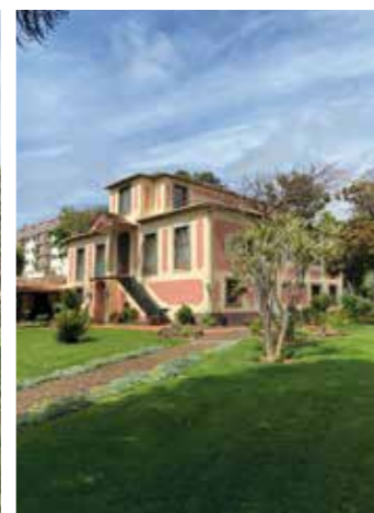
Perspectiva da Casa Mãe